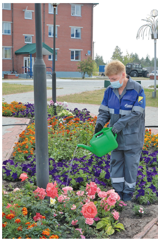
Победа в конкурсе среди жилых поселков – невероятная мотивация для всех работников Ортыгунского ЛПУ

– Работники Ортыгунского ЛПУ очень рады, что одержали победу в конкурсе на лучший жилой поселок, завоевав первое место. Ведь когда вкладываешь во что-то все свои силы и получаешь высокую оценку, это всегда очень приятно. Это невероятная мотивация для персонала, для достижения следующих грандиозных целей, постоянного улучшения условий проживания работников станции и членов их семей. Однако подобные победы неожиданными не бывают: мы активно работали не покладая рук, готовились к этому конкурсу. Постараемся и в следующем году остаться в числе лидеров. Конечно, у нас существуют резервы для роста – хочется занять призовые места в каждой из четырех номинаций, тем более что поставленные перед управлением задачи мы всегда выполняем на 100%. Так что будем дальше работать над собой и добиваться новых побед.