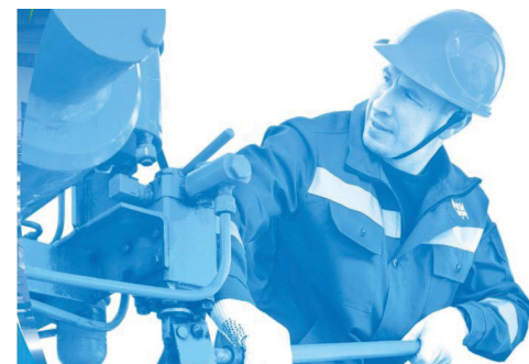
2022 год: запланированы и профконкурсы, и фестиваль труда

Стоит также напомнить, что 2022 год ознаменован и запланированным на сентябрь фестивалем труда ПАО «Газпром». Впервые он был проведен в 2018 году, в нем приняло участие более 150 специалистов из 30 дочерних обществ. Как отметил в своем выступлении председатель правления Газпрома Алексей Миллер, мероприятие позволило участникам обменяться прогрессивным опытом, найти новые возможности для профессионального развития, став площадкой для генерации передовых идей и методов работы.