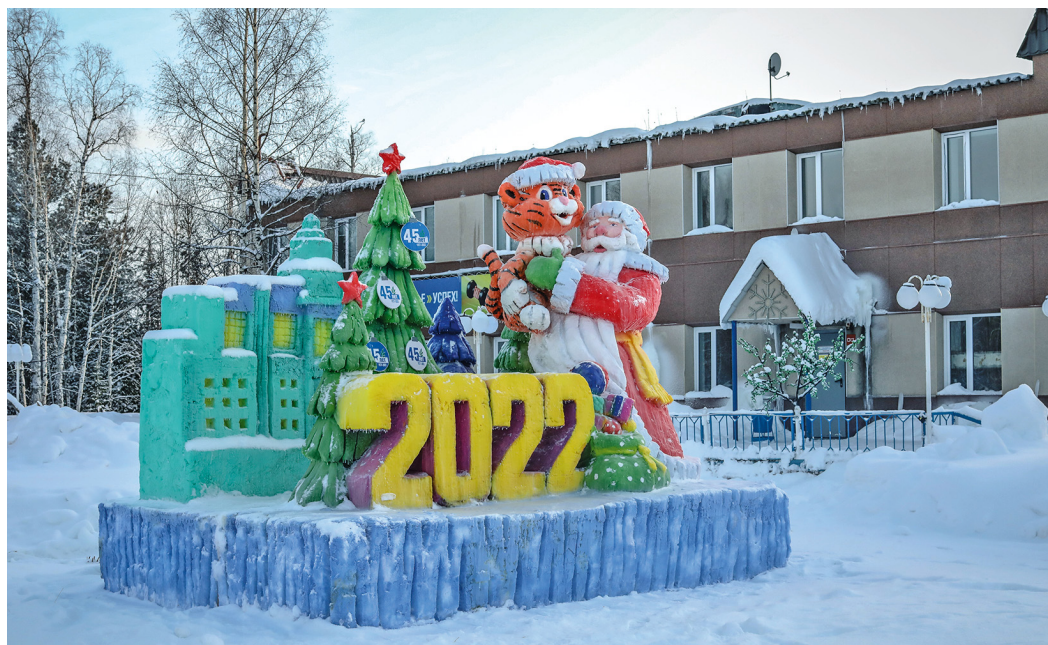
Вахтовый поселок Аганской промплощадки – заслуженный победитель конкурса