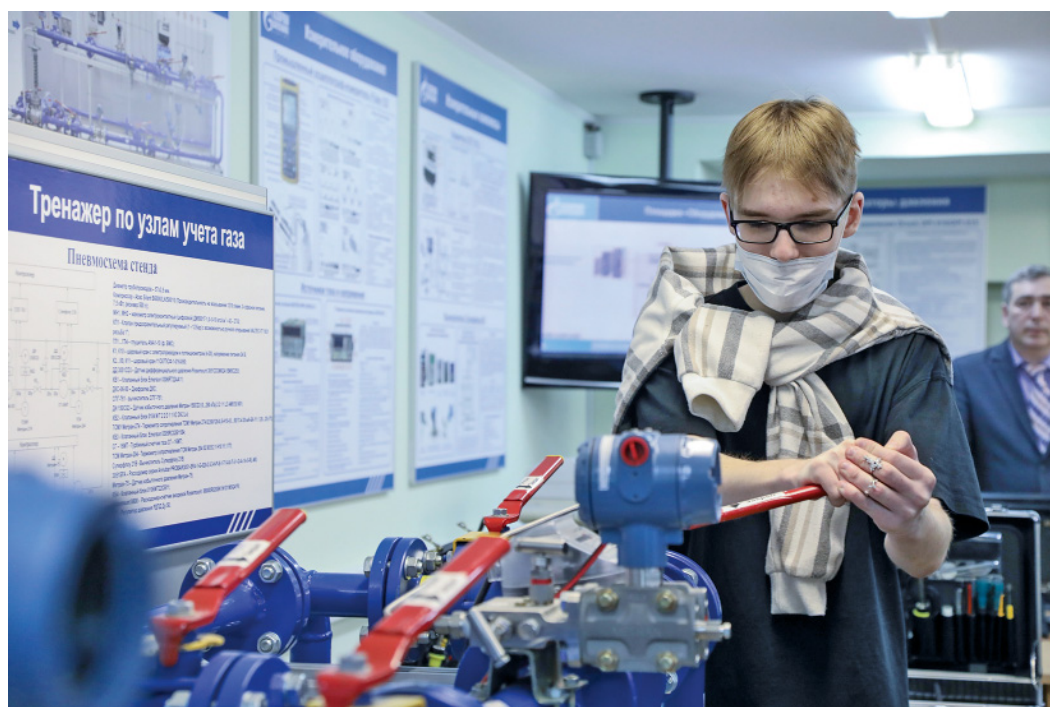
В Учебно-производственном центре есть тренажеры, помогающие освоить разные профессии

После просмотра одного из видеопособий гости отправились в кабинет подготовки персонала ЛЭС и ГРС. Здесь им рассказали об основных профессиях в транспорте газа: операторе газораспределительной станции, трубопроводчике линейном, изолировщике-