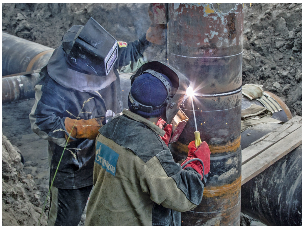
Комплексный ремонт трубопроводов затронет еще три промплощадки предприятия

2022 год станет временем проведения капитального ремонта технологических трубопроводов вторых цехов Пурпейского (КС-02), Южно-Балыкского и Демьянского ЛПУ. Ранее на данных объектах, введенных в строй практически в один период – 1980-е годы, была проведена оценка их технического состояния.