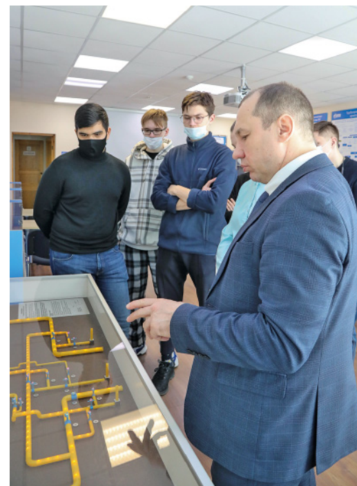
Школьники пробовали произвести запуск и прием внутритрубного снаряда на тренажере

Словом, экскурсия получилась на редкость познавательной и очень понравилась школьникам.