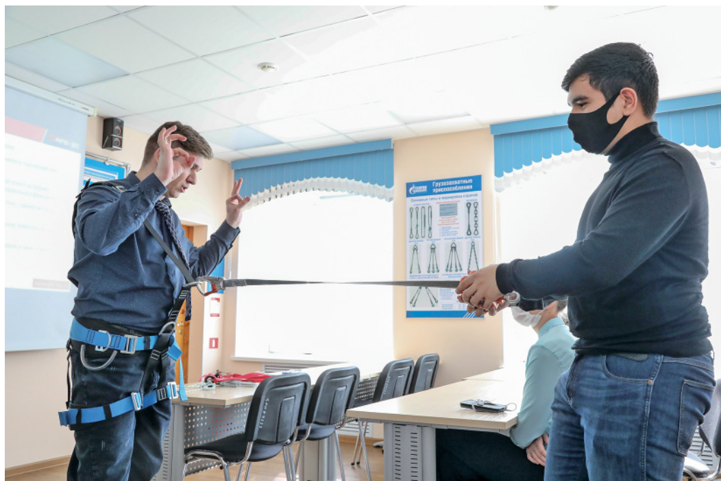
Показательный урок по работам на высоте: правила безопасности должен знать каждый. Школьники проверили на себе надежность страховки

пленочнике и т.д. На установленном в аудитории тренажере школьники могли, например, попробовать произвести запуск и прием внутритрубного снаряда.