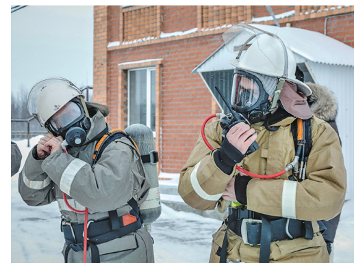
АП «Омега-север» разработан специально для применения в широком диапазоне температур

Напомним, что с недавнего времени сфера ответственности спасателей штатного аварийно-спасательного формирования Общества расширилась – к аттестованным видам работ добавилась работа по ликвидации