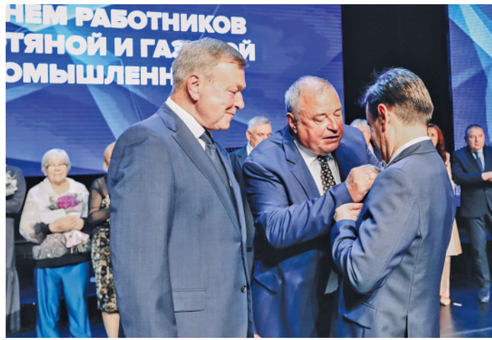
Нечасто увидишь трех «генералов» на одной сцене