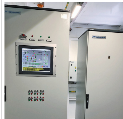
ГРС «Пышминская» – один из образцов газораспределительной станции Общества с современными средствами автоматизации

Одна из ключевых задач ремонтов – повышение уровня автоматизации (телеуправления охранными кранами ГРС) технологических объектов, что влияет на оперативность решений и принятие своевременных мер по закрытию запорной арматуры с рабочего места оператора ГРС при возникновении возможных аварийных ситуаций.