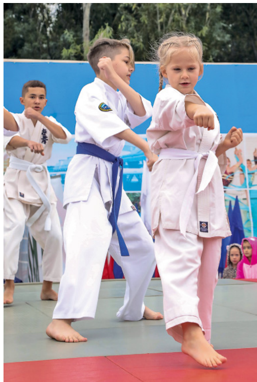
В настоящей женщине все прекрасно. Даже кулаки!