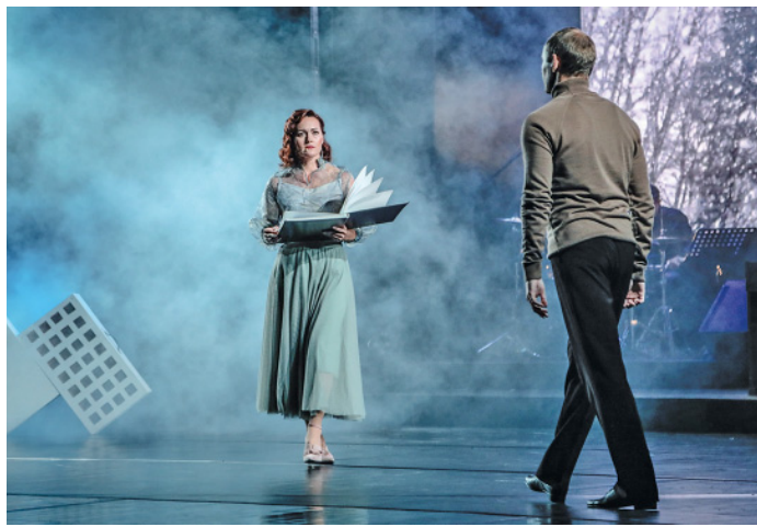
45-летний том истории предприятия – благодарным потомкам