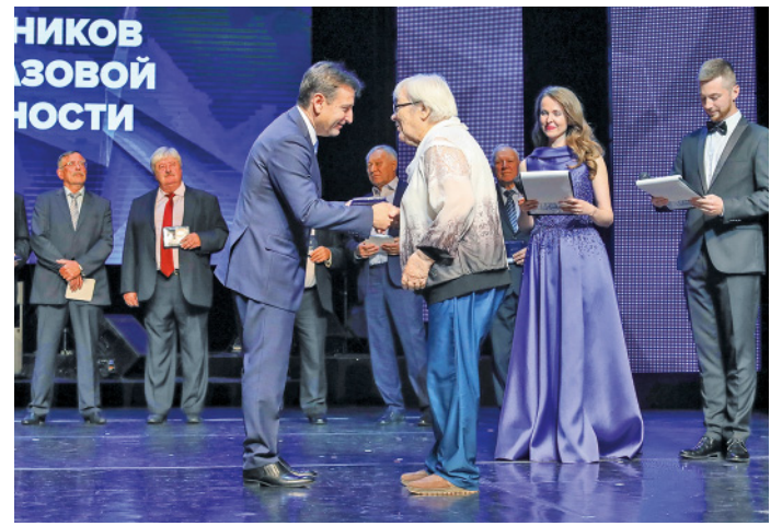
С особой теплотой в этот день чествовали ветеранов