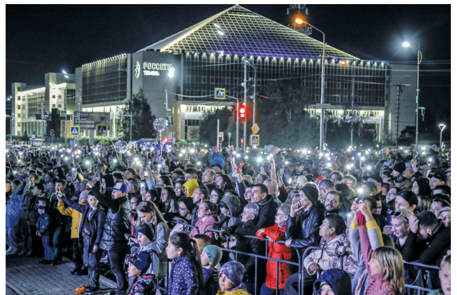
Зрители с фонариками помогли конференсье находить подходящие реплики