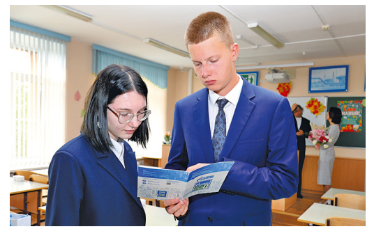
Изучаем план мероприятий