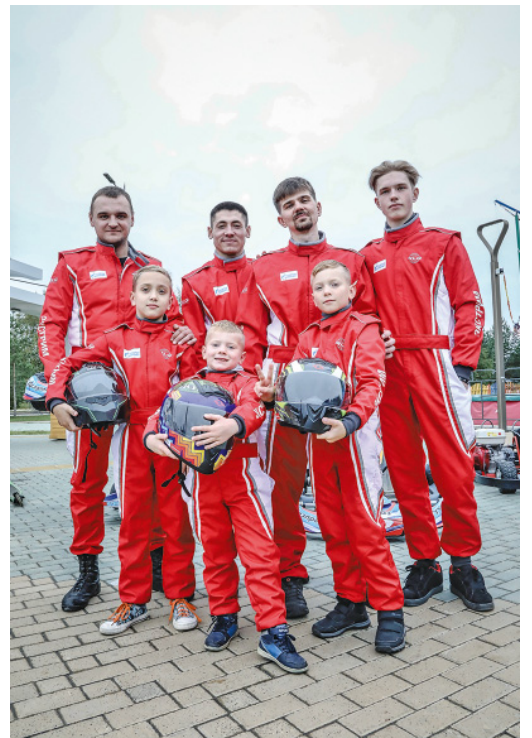
Сборная по боевым шашкам и «Чапаеву» готова к турниру