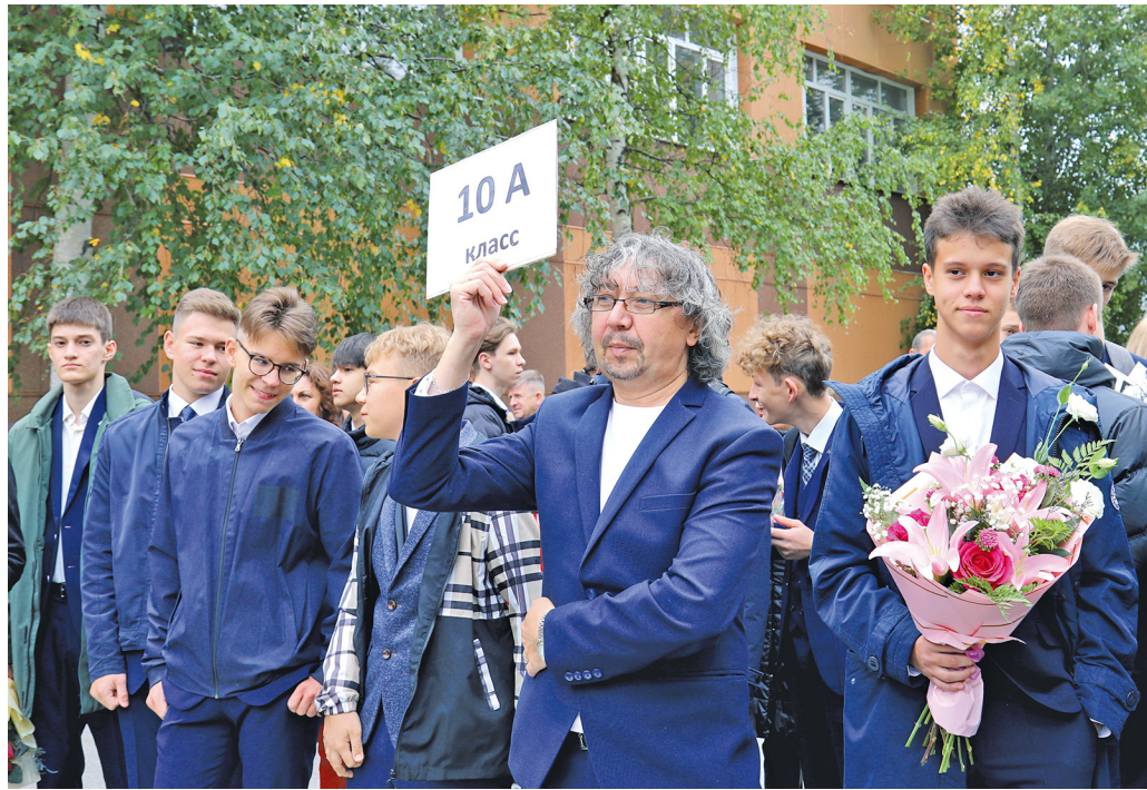
«Газпром-класс» к учебному году готов!