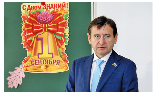
«Молодым специалистам у нас всегда рады»

Все выпускники «Газпром-класса» в 2022 году успешно сдали единый государственный экзамен по обязательным и профильным предметам. Так, средний балл по математике профильного уровня у наших ребят составил 74 и выше (показатель по стране 56,9 балла), по русскому языку – 79 (по стране – 68,3), по физике – 72 (по стране 54,1), по информатике – 75 (по стране 59,5). Шесть учеников получили аттестат с отличием. Кроме того, шестеро ребят были удостоены золотой медали России «За особые успехи в учении». Их достижения – отличный пример для подражания и подтверждение того, что при желании и должном старании каждый способен достичь поставленных целей.