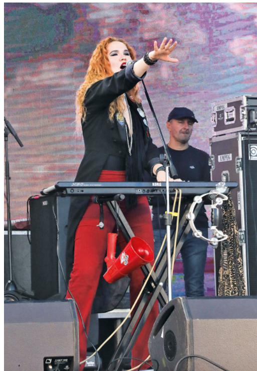
«А сейчас я разгоню своим голосом облака над Сургутом...»