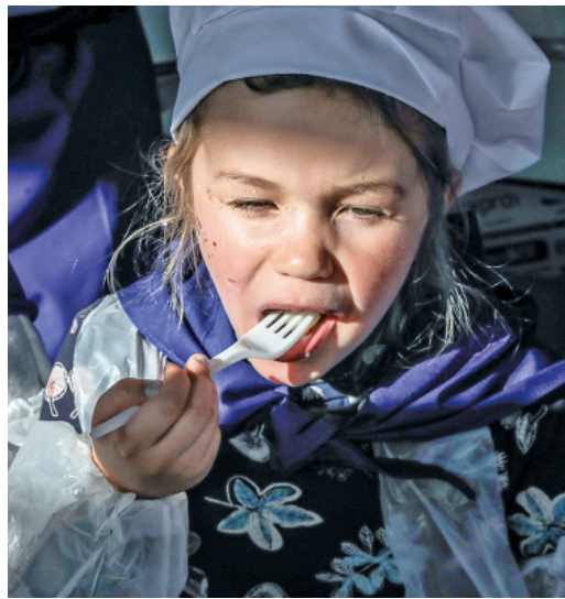
Нет ничего вкуснее самостоятельно слепленных вареников