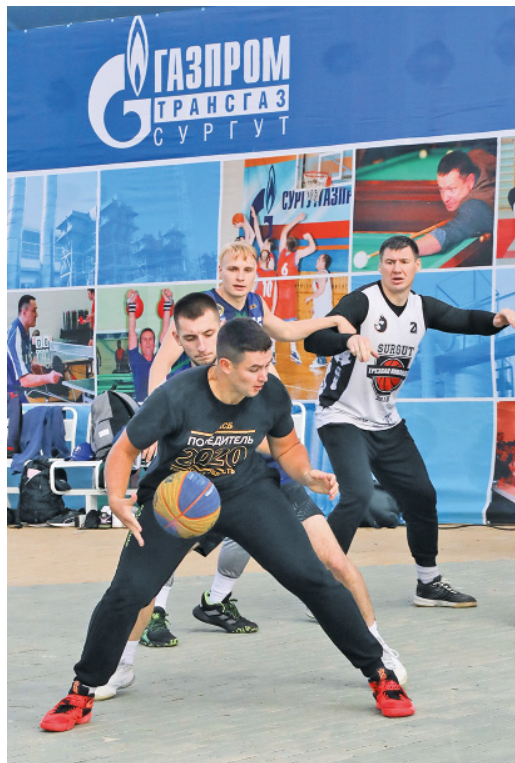
Пантомима под названием: «Кто последний за арбузом?»