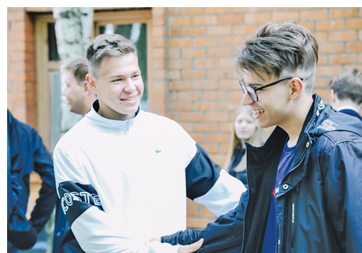
Участие в тренинге как повод узнать друг друга ближе