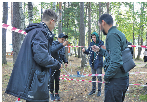
Слаженные действия команды – залог успеха

– Тот факт, что вы пришли учиться в профильный класс, уже говорит о том, что вы на правильном пути. В нашем городе немало крупных предприятий, да и Газпром – это не только наш офис на улице Университетской, но и завод по стабилизации конденсата, и ГРЭС-1, и ряд филиалов Общества. И все мы заинтересованы в приеме на работу талантливых молодых специалистов. Наверняка многие из вас, планируя получить высшее образование в столице и других крупных городах страны, подумывают о том, чтобы по окончании учебы там и остаться. Можно, конечно, пойти по этому пути и ничего не добиться из-за высокой конкуренции и отсутствия там достойных рабочих мест. Но я бы рекомендовал помнить о том, что вы родились и выросли в одном из самых богатых и экономически стабильных регионов России, где, работая в нефтяных и газовых компаниях, вы получаете уникальную возможность приобрести богатый профессиональный опыт и построить хорошую карьеру. И главное – здесь вас всегда ждут.