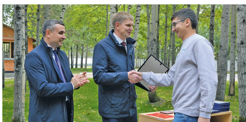
Добро пожаловать в Газпром!

– За время учебы в «Газпром-классе» ребята познакомятся со всеми направлениями деятельности предприятия, побывают на экскурсиях в разных филиалах, примут участие в многочисленных тематических олимпиадах, в том числе – в корпоративных, на уровне ПАО «Газпром». Добро пожаловать в нашу большую семью, на предприятие, где всегда поддерживают инициативных специалистов, где у каждого есть возможность стать настоящим профессионалом своего дела.