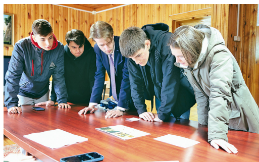
Коллективный разум «рулит»