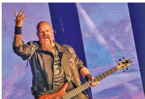
Именно так должен выглядеть настоящий доктор философии