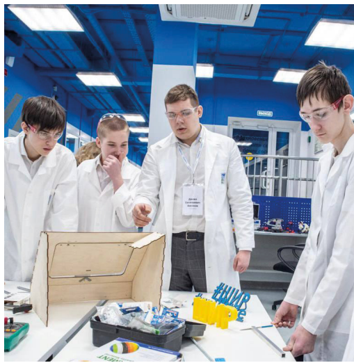
Тюменские школьники готовятся стать инженерами

Отметим, что с 2015 года Тюменский индустриальный университет является опорным ВУЗом ПАО «Газпром» и одним из ключевых