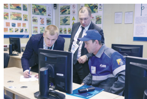
Проверка теории – важная часть смотра