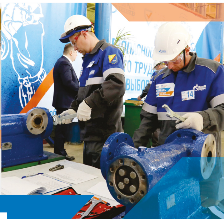
Слесарь по ремонту технологических установок