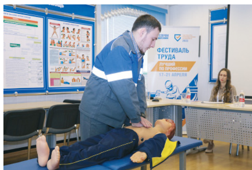
«Гошу» в этот день реанимировали не один раз