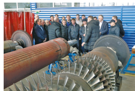
Один из пунктов программы – экскурсия в ремонтный цех