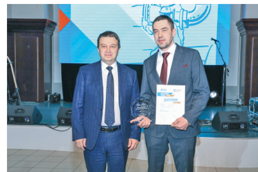
Лучших участников Фестиваля награждает главный инженер