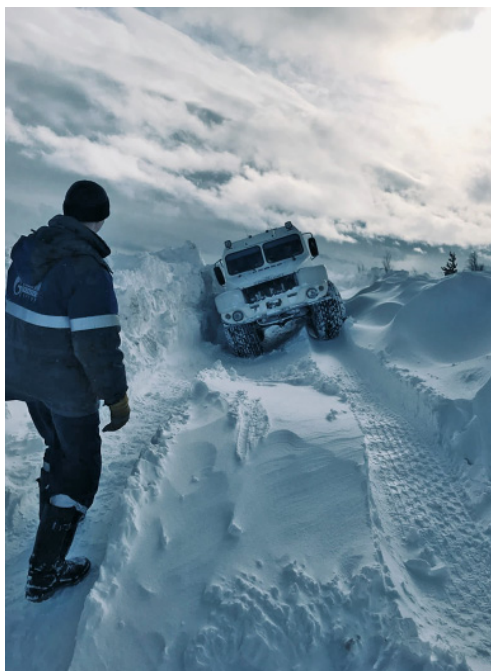
Пробираясь через сугробы

Производственные сводки говорят о многом. Но иногда больше способны сказать сопровождающие их фотографии. «Труднодоступность мест ремонта, обводненность местности, мартовские метели, переходящие в настоящие суровые бураны, не смогли помешать завершить работы в срок. Очередной раз доказано – трудности не только укрепляют и сплачивают коллектив, но и дают возможность проявить настоящий мужской характер, выдержку и смекалку», – написали коллеги к фотографии, которая, на наш взгляд, достойна как минимум корпоративного конкурса.