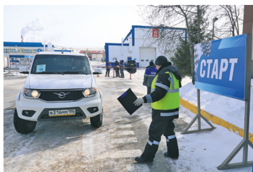
Водители показали мастерство управления транспортом