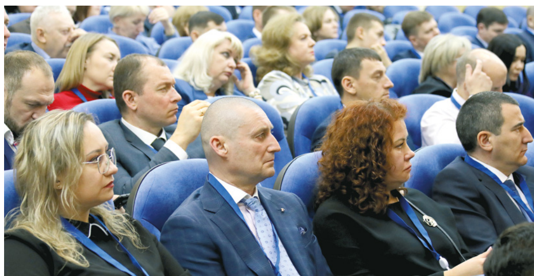
Делегаты конференции заслушали отчет о работе ОППО, проголосовали за избрание нового председателя

– Серьезная роль здесь у комиссии по регулированию социально-трудовых отношений. Несмотря на все сложности, колдоговор в отчетный период мы пролонгировали с максимальным сохранением всех выплат, гарантий и компенсаций. И это значимое достижение, – подчеркнул председатель ОППО. – Также немаловажно, что в рамках социального партнерства наши представители есть во всех комиссиях: по КПЖО, по проверкам объектов общественного питания, подготовке норма-