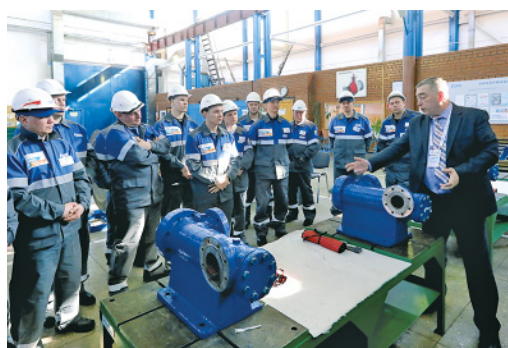
Слесари по ремонту ТУ во время «разбора полетов»