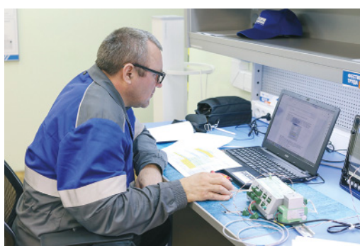
Слесари КИПиА на «ты» с современными технологиями