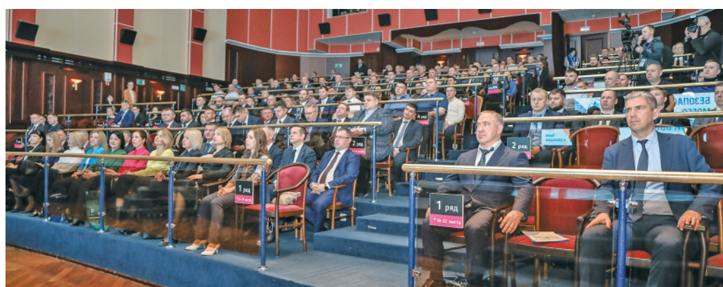
Домом Фестиваля стал ЦКид «Камертон»