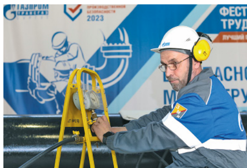
Линтрубам досталось сразу два практических задания