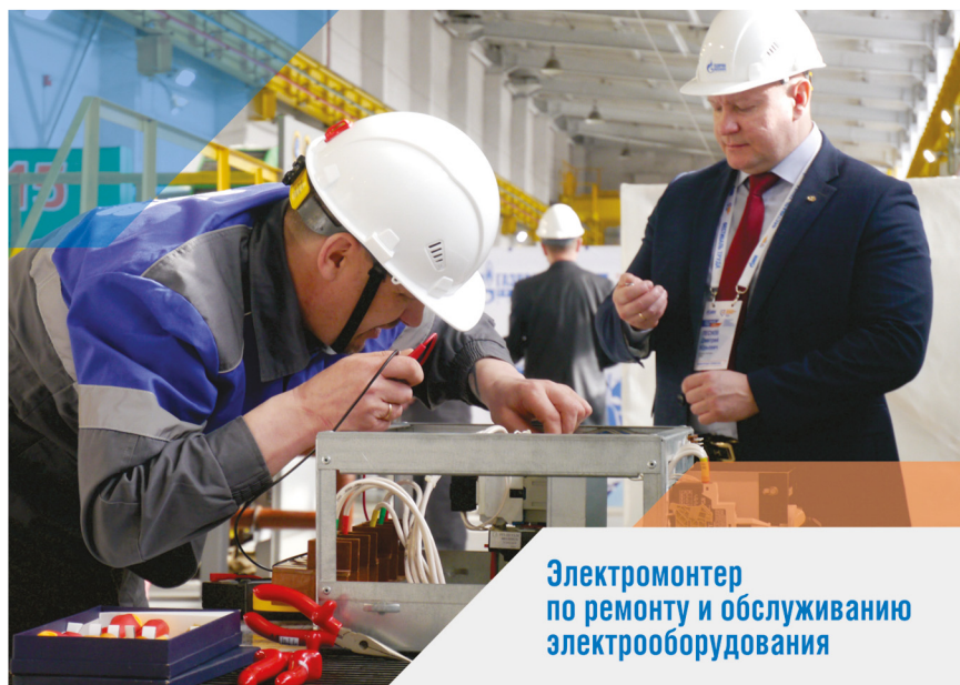
Электромонтер по ремонту и обслуживанию электрооборудования