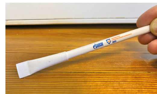
Ручки из картона – от сургутских газовиков

Таким образом, до начала июля во всех филиалах предприятия появятся места временного накопления отходов по отдельному принципу (отдельно станет накапливаться пластиковая продукция, не загрязненная пи-