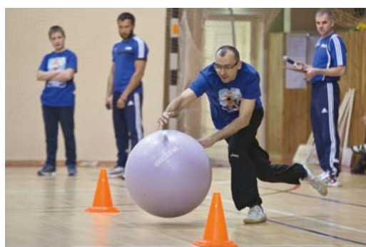
Папа из семьи Аноповых (администрация) ловко управлялся с мячом-фитболом