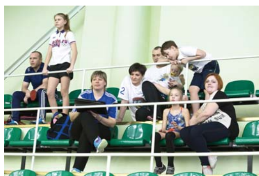
Выступив в очередной раз, команды участников на время превращались в болельщиков