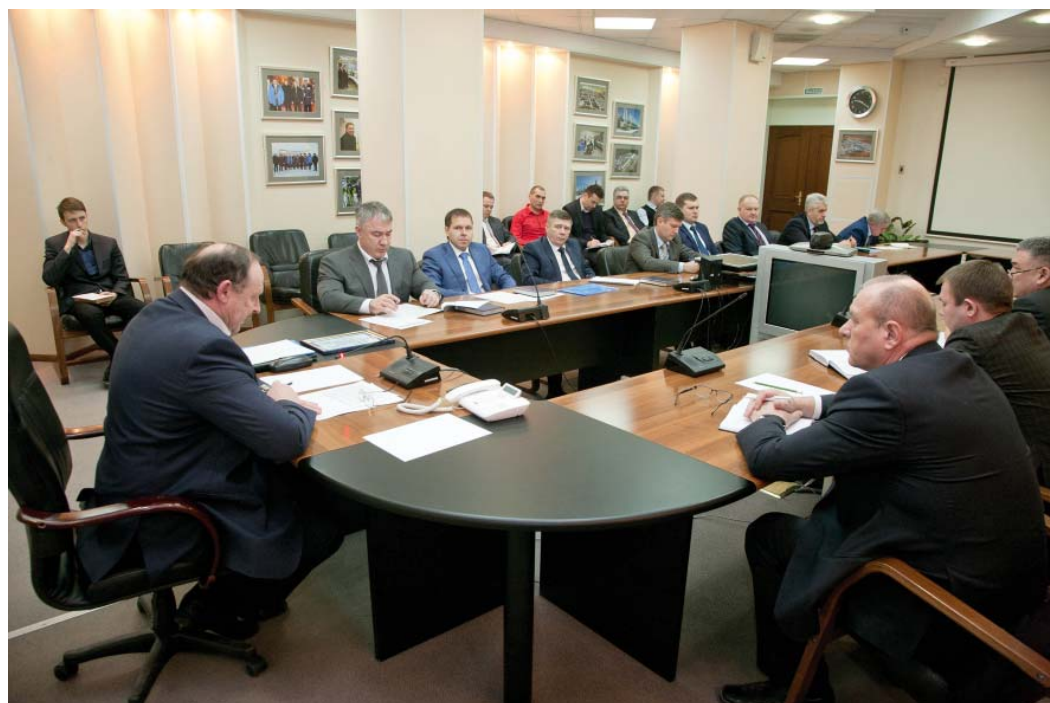
Для решения некоторых проблем, связанных с дисциплиной сотрудников Общества, руководство намерено прибегнуть к самым жестким мерам

Несмотря на все принимаемые в последнее время меры, далека от решения и проблема использования работниками личного ав-