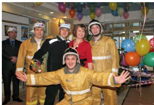
С ними и в огне не сгорюшь, и в воде не утонешь