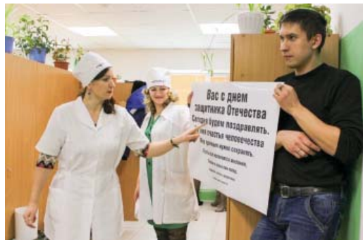
Дамы Орьягунки решили отправить своих мужчин в армию: «Надоели»

В ответ же сильная половина Орьягунки приготовила не менее креативный сюрприз – мужчины сняли художественный фильм в традициях старого немое кино – «С 8 Марта, дамы!», в котором сами же и снялись в роли актеров.