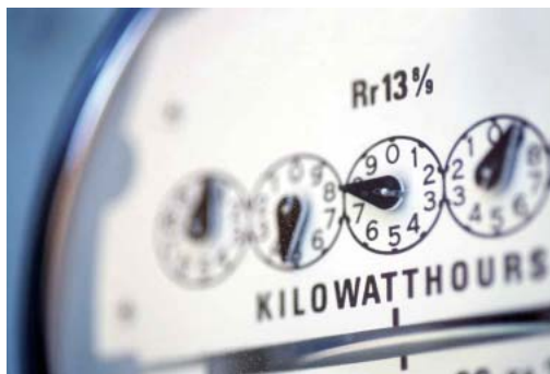
Точный расчет – и экономим счет: подход энергетиков Общества к экономии энергоресурсов себя оправдал полностью

– Но специалистам наших филиалов, конечно, нет повода расслабляться, – поясняя