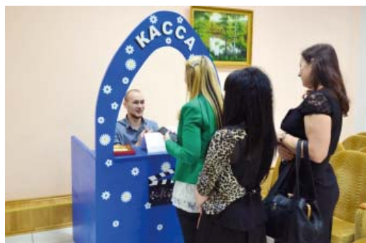
Купить билет в кинотеатр КС-2 можно было просто за красивые глаза