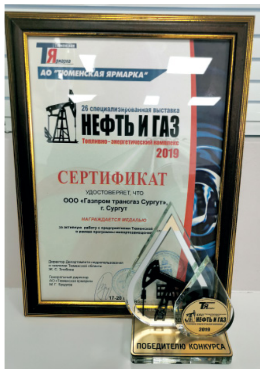
Почетная награда от организаторов выставки за активную работу с предприятиями области

По итогам выставки ООО «Газпром трансгаз Сургут» было награждено медалью за активную работу с предприятиями Тюменской области в рамках программы импортозамещения.