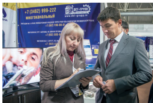
В ходе выставки завязывались новые деловые контакты с производителями