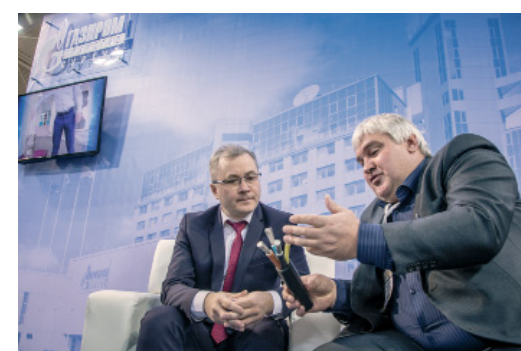
Выставка – как площадка для общения

в этот раз мы очень плодотворно пообщались с представителями АО «Флот» – разработчиками катеров на воздушной подушке. Напомню, что с весны 2019 года судно подобного типа впервые было использовано на переправе через реку Пур (Ново-Уренгойское ЛПУ). Опыт эксплуатации таких катеров у нас пока небольшой, поэтому встречи с разработчиками в рамках форума «Сургут. Нефть и газ» получились крайне полезными в части дальнейших доработок