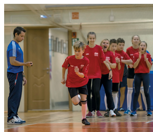
Победителями, как и в прошлом году, стала команда Администрации

Кстати говоря, состав призеров этого года на две трети повторил прошлогодний: борьбу заряженным на победу представителям команд Администрации и УСС «Факел» в этом году смогли навязать только делегаты Яркового ЛПУ, которые совершенно заслуженно стали бронзовыми призерами соревнований. В 2018 году, напомним, на третьей позиции итогового протокола финишировали юные спортсмены из УАВР, однако год спустя они на завоеванных позициях закрепиться не сумели, заняв лишь пятое место.