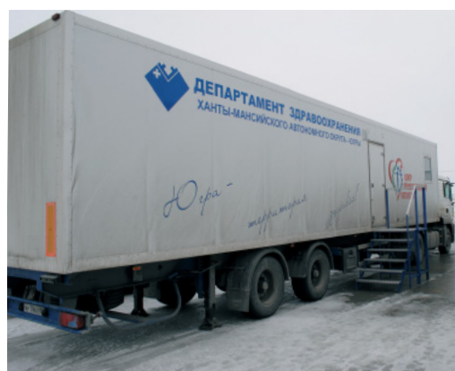
«Волшебный» трейлер здоровья едет по трассе

Всего же благодаря работе специалистов «Югорского центра профессиональной патологии» периодические медосмотры на текущий момент прошли 1 882 человека. До конца года врачи центра обслужат еще 950 работников ООО «Газпром трансгаз Сургут». Кроме того, еще 1 559 газовиков предприятия были обследованы докторами МСЧ. Согласно плану, ПМО здесь должны пройти еще около восьмисот сотрудников компании.