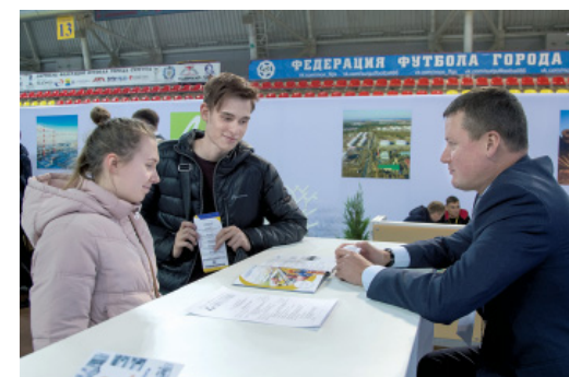
Молодежь больше всего интересовалась перспективами трудоустройства в Газпром