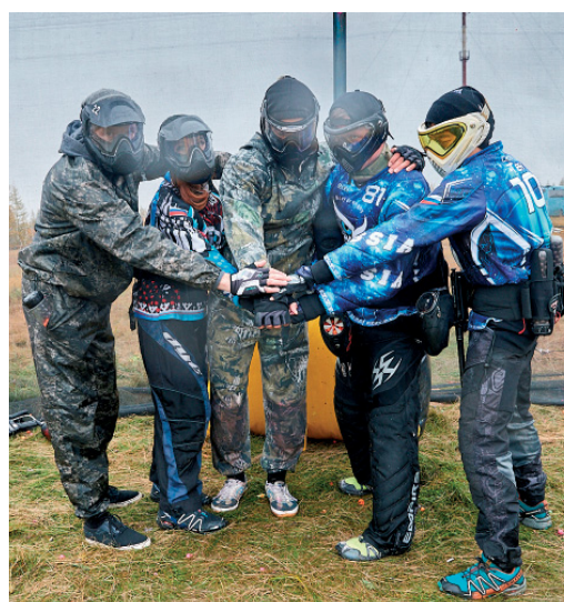
«Хочешь мира – почаще играй в пейнтбол», считают в Губкинском ЛПУ

Мероприятие проходило в Новом Уренгое и было посвящено 50-летию Южно-Русского нефтегазоконденсатного месторождения. Организатор – ОАО «Севернефтегазпром» проводит турнир на регулярной основе уже более пяти лет. Команды представили разный уровень физической подготовки, продемонстрировали разнообразные тактические действия на поле. Одни коллективы делали упор на скорость передвижения, другие – на меткость. Особого экстрима в соревновании добавила дождливая погода – спортсменам нужно было не только уклоняться от попаданий противника, но и держать равновесие на скользкой траве. В итоге сборная Губкинского ЛПУ стала серебряным призером турнира, уступив первое место спортсменам из ООО «Газпром добыча Ноябрьск». Третье место заняли представители ООО «Газпром добыча Надым».