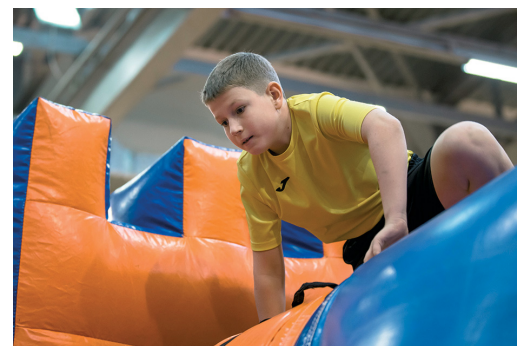
Представители Пурпе очень старались...