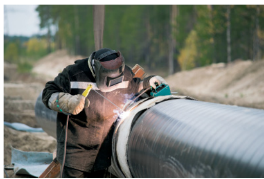
Новые трубы свариваются в плети. Затем качество сварных швов проверяют рентгеновскими аппаратами