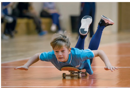
Ярковоцы благополучно добрались до бронзы