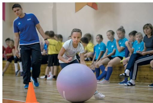
Классическая композиция: девочка и шар