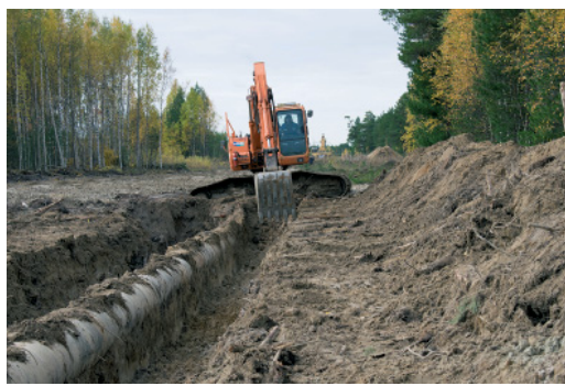
Тем временем вскрывается очередной участок газопровода