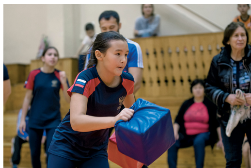
Непростые «кубометры» спорта