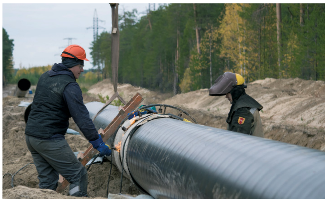
Разогрев сварного стыка

Нитку трубопровода, подлежащую замене, вскрывают при помощи экскаваторов, разрезают и вытаскивают из траншеи. Тут же свариваются плети заранее привезенной и аккуратно складированной новой трубы. Она уже покрыта заводской изоляцией, поэтому монтаж проходит быстрее. Изолировать приходится только стыки, на которые устанавливаются термоусаживающиеся муфты. Но сначала сварные швы подвергаются контролю импульсными рентгеновскими аппаратами – нужно убедиться, что работа сварщиков выполнена без дефектов. Если все хорошо и брака нет, последует укладка нового трубопровода в траншею, его балластировка и обратная засыпка.