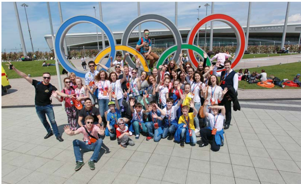
Сочи: горы, море, олимпийские объекты и вагон положительных эмоций

Два года назад во время гала-концерта предыдущего фестиваля в Витебске с высокой сцены-трибуны было объявлено, что следующий финал «Факела» впервые в истории состоится в дальнем зарубежье – в Любляне (Словения). К сожалению, по ряду причин этим планам не суждено было осуществиться, и решающий тур шестого по счету конкурса самодеятельных творческих коллективов и исполнителей дочерних обществ Газпрома было решено провести в Красной Поляне (Сочи). Забегая вперед, отметим: никого из участников и гостей фестиваля такая замена ничуть не разочаровала. Не знаем, как бы там все сложилось в Любляне, но послеолимпийский Сочи покорила буквально всех!