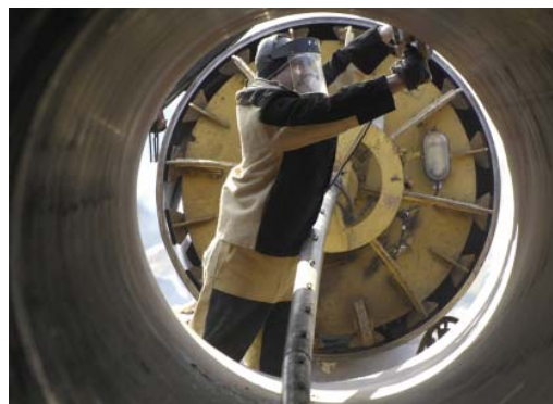
Сварка для газовиков на 100% стала российской

По большому счету, к решению отойти от зарубежного Газпром пришел не вчера и не в связи с антироссийскими санкциями (хотя этот процесс и дал дополнительный толчок). Системная работа по замене импортных образцов техники, оборудования и материалов на российские в холдинге практикуется с 2003 года. И понятно почему: Газпром – компания российская и поддерживает отечественных производителей.