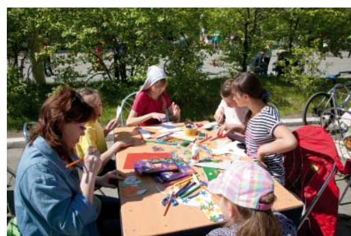
Конкурсы были на любой вкус: на развитие творческих талантов...

В воскресенье, 31 мая, на площади и в зрительном зале ЦКиД «Камертон» вниманию юных сургутян был представлен новый масштабный шоу-проект «Фабрика шалостей «Выкрутасы с Барабасом» и красочные театрализованные программы, участниками которых стали более 150 воспитанников студий «Камертона», а зрителями – более трех тысяч человек. На площади перед центром культуры и досуга на пяти развлекательных площадках для детей было организовано более пятнадцати разнообразных конкурсов, в которых они могли выигрывать купоны, а затем обменивать их на призы. Мероприятие было организовано ООО «Газпром трансгаз Сургут» при поддержке молодежных объединений ООО «Газпром трансгаз Сургут» и ООО «Газпром переработка», а также сургутского филиала Стрелковой группы СОГАЗ.