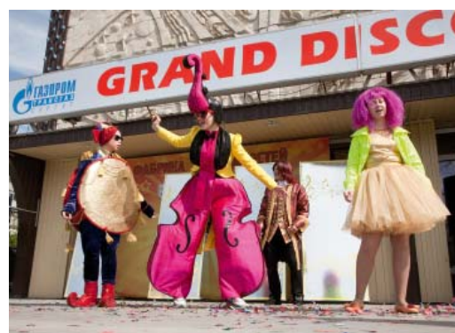
«Выкрутасы с Барабасом» – главная изюминка большого детского праздника

во газопровода», в рамках которого дети соорудили газовую магистраль из... коктейльных трубочек и пластиковых стаканчиков. Проигравших в этот день не оказалось – все участники проекта «Зов джунглей» получили памятные призы.