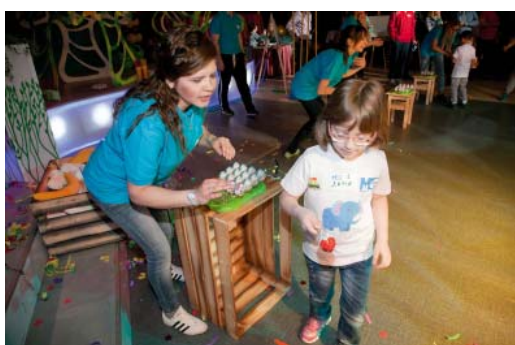
Проигравших не было – всем участникам программы достались призы