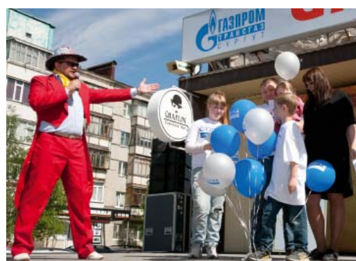
Зрителями детской программы стали около трех тысяч сургутян

В программе под названием «Зов джунглей» (созданной по мотивам известного детского телепроекта) приняли участие 60 детей работников предприятия в возрасте от пяти до девяти лет. Девочки и мальчики разбились на четыре отряда «хищников» и «травоядных» и с большим удовольствием принимали участие в многочисленных конкурсах. Одним из них стало задание «Строительство