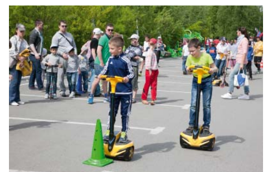
... а также подвижно-спортивные – для укрепления физической формы