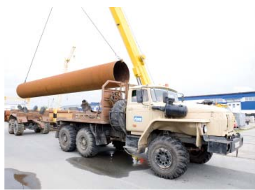
Машины с грузами преодолели в 2014 году шесть экваторов

В Сургуте в конце мая тоже прошло большое совещание, правда, не по узкой тематике, а в целом по вопросам снабжения Общества материально-техническими ресурсами, итогам и задачам УМТСиК на текущий год.