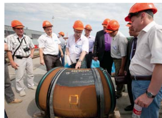
Систему антиконтрафакта сургутяне обкатали в двух ЛПУ

Однако есть отдельные примеры того, где наши производители пока не заняли нишу: досадно, к примеру, что ими до сих пор не освоено производство такой мелочи, как перчатки с полимерным покрытием, выпускают которые в странах Юго-Восточной Азии. За наших китайских друзей мы, конечно, рады, но все-таки хочется, чтобы этот рынок освоили отечественные производители.