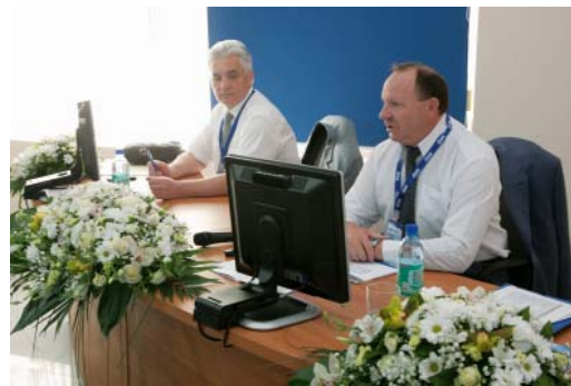
Главные инженеры рассмотрели программу капремонта МГ на четыре года

В докладах также были отражены вопросы по анализу технического состояния и прогнозу остаточного ресурса ТПО компрессорных станций, повышение качества технического обслуживания и ремонта оборудования КС, снижения оксидов азота в выхлопных газах ГТУ и перспективы выполнения програм-