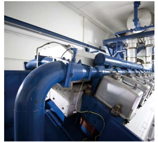
На эксплуатации «Вяртсиля» газовики не первый год экономят деньги

успешно реализуют мероприятия, связанные с эксплуатацией электростанции собственных нужд (ЭСН) «Вяртсиля», такие как: «Оптимизация работы электрогенерирующих агрегатов ЭСН» и «Теплоснабжение объектов промплощадки в весенний и осенний периоды за счет рубашки охлаждения агрегатов ЭСН «Вяртсиля». В 2014 году нашими коллегами таким образом было сэкономлено 6380 тыс. куб. м природного газа. Также на итоговую оценку в конкурсе повлияло улучшение показателя энергоэффективности работы ЛПУ по сравнению с 2013 годом, что было достигнуто за счет оптимизации работы газотранспортной сети и поддержания технического состояния основного оборудования по мощности на должном уровне.