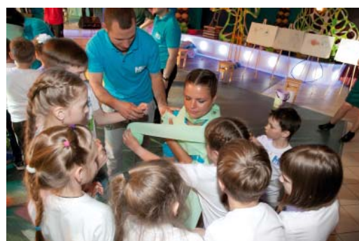
В этот день «Джунгли» позвали 60 детей работников ООО «Газпром трансгаз Сургут»

во газопровода», в рамках которого дети соорудили газовую магистраль из... коктейльных трубочек и пластиковых стаканчиков. Проигравших в этот день не оказалось – все участники проекта «Зов джунглей» получили памятные призы.