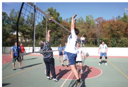
Как смена деятельности – спорт

ЛПУ). На последнем объекте работы уже выполнены, осталось лишь провести испытания.