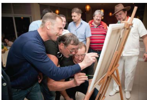
Творческий отдых – с кистью и холстом

териалы, спецодежда и СИЗ. «Запас хороший и серьезный, соответствует всем нормативам Газпрома», – заключил он.