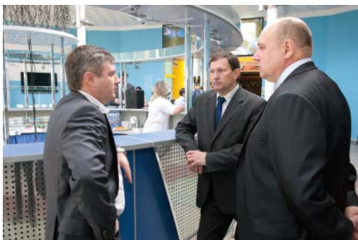
Обсуждение производственных вопросов продолжалось и в перерыве