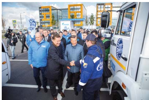
Первым посетителем экспозиции стал Алексей Миллер

Автобус ООО «Газпром трансгаз Сургут» финишировал в Санкт-Петербурге в рамках всероссийского автопробега «Газ – в моторы!». В составе автоколонны газомоторной техники ПАО «Газпром» белоснежный КАВЗ-4238 «Аврора» проехал без малого три тысячи километров.