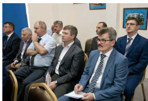
Участники Совета заслушали и приняли к исполнению рекомендации руководства