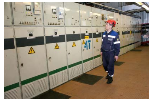
Электроэнергия требует строжайшего учета

Авторы же проекта ставят перед собой цели «научить» АСКУЭ учитывать все объемы электрической энергии, которыми оперирует Общество, что позволит использовать весь функционал системы в полном объеме. Все это должно упростить и ускорить работу по учету электроэнергии в Обществе, сделать этот процесс более детальным и прозрачным, что имеет огромное значение при существующей модели оптового и розничного рынков электроэнергии, полноценным членом которых является ООО «Газпром трансгаз Сургут». В перспективе в АСКУЭ планируется