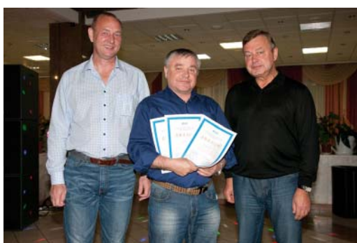
Губкинское ЛПУ – одно из лидеров производственного соревнования по итогам первого полугодия