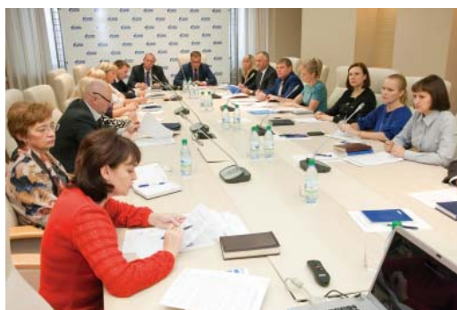
ОПО и администрация подготовили подарок газоведам

Рождественским подарком для всех членов профсоюзной организации Общества станет новое издание коллективного договора ООО «Газпром трансгаз Сургут». Решение о переиздании главного социального документа было принято на недавнем заседании комиссии по урегулированию социально-трудовых отношений предприятия.