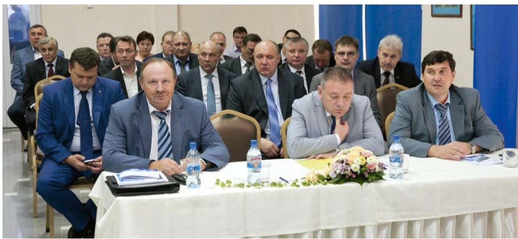
В повестке дня заседания Совета руководителей значилось два основных вопроса – о готовности филиалов Общества к работе в осенне-зимний период и итогах санаторно-курортного лечения и оздоровления работников

Хорошо подготовиться к зиме помогли в том числе и заранее сформированные запасы материалов и оборудования. По словам главного инженера, вопросом создания единого аварийного запаса в нашем Обществе занялись год назад, и за это время удалось неплохо укомплектоваться – это и трубы, и запорная арматура, всевозможные расходные ма-