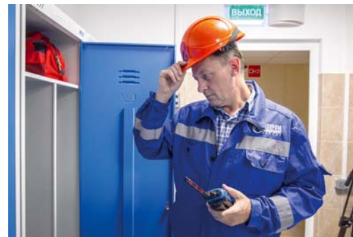
Выходя на территорию производственного объекта, не забываем надеть каску