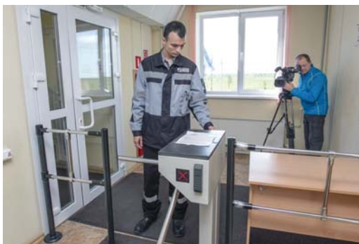
Контрольно-пропускной режим на компрессорной станции – обязателен

Продолжительность ролика – порядка пяти минут, все коротко и ясно, ничего лишнего. А вот наполнение, сцены и декорации, конечно, везде разные, в зависимости от филиала и специфики деятельности – будь то, например, ав-