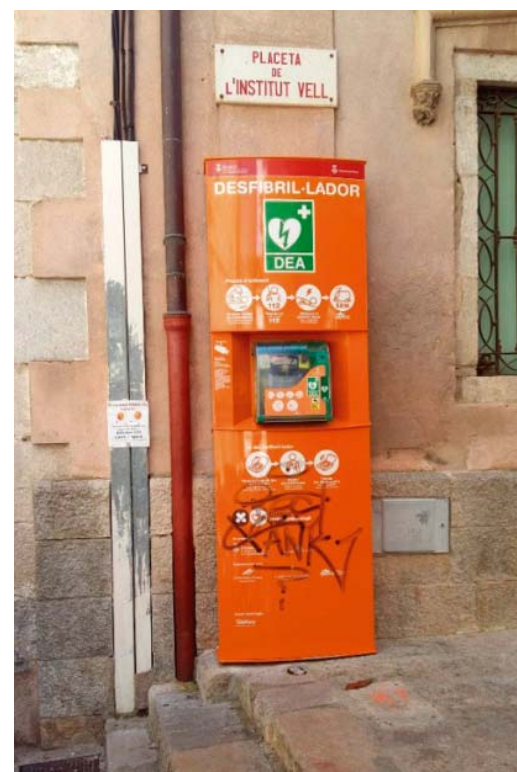
Уличный автоматический дефибриллятор в г. Жирона, Испания

– Дефибриллятор – самое эффективное средство при сердечно-легочной реанимации, – продолжает она. – Что он собой представляет? Это аппарат, восстанавливающий работу сердца ударом электрического тока. Внезапная аритмическая смерть – это состояние, когда мышечные волокна сердца работают разрозненно, в результате чего оно не сокращается, а дрожит. Электрический импульс синхронизирует работу мышц, восстанавливая нормальные сердечные сокращения. Такие аппараты есть в каждой реанимации, есть он и в нашей МСЧ, но это довольно сложные устройства, которыми могут пользоваться только специалисты-медики. Однако уже давно во всем цивилизованном мире широко используются дефибрилляторы «общего пользования» –