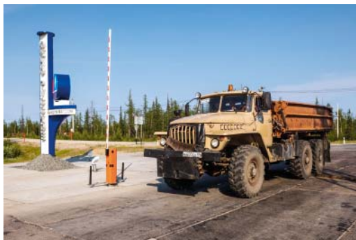
Перспективная задача компании – усилить мощность технологических проездов

Вдольтрассовые проезды севера газовой магистрали ООО «Газпром трансгаз Сургут» могут полностью заменить газопроводам федеральные и региональные автодороги: в Обществе рассматривается возможность усилить мощность и грузоподъемность технологических проездов линейной части, чтобы по ним могли передвигаться любые виды транспорта, используемые нашим предприятием.