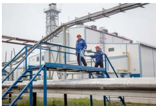
Переходы через трубопроводы – одно из мест, где по неосторожности можно получить травму