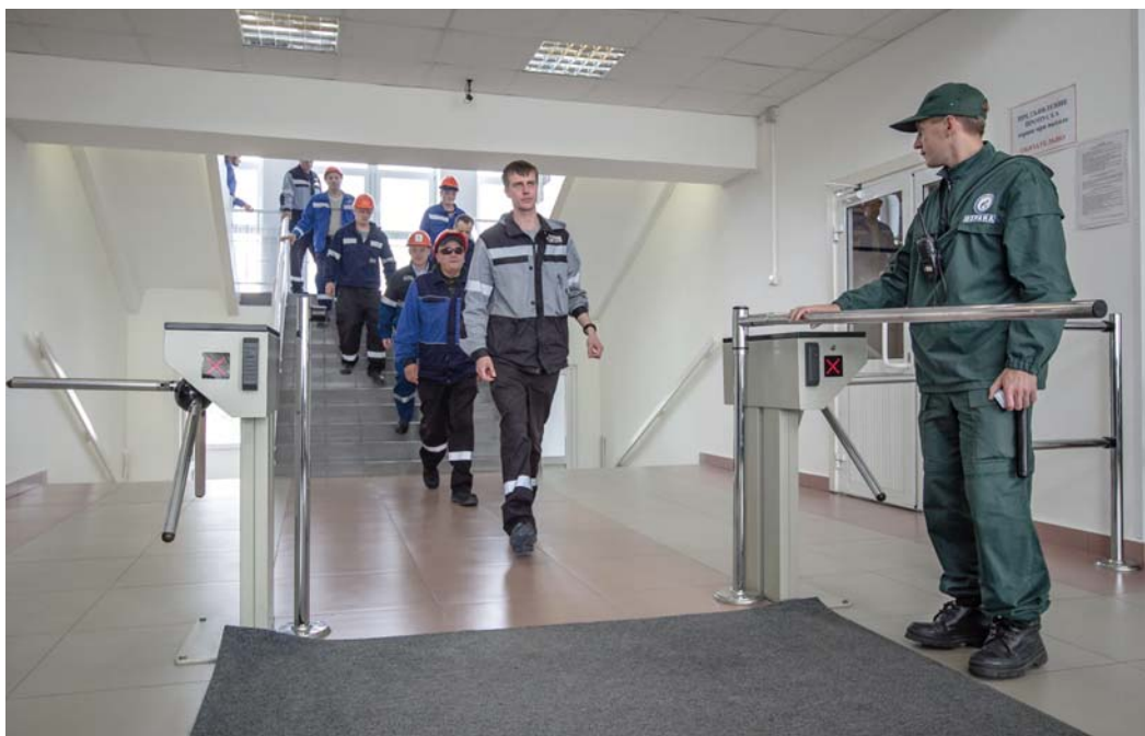
В случае тревоги будьте готовы организованно эвакуироваться. Даже если она – учебная