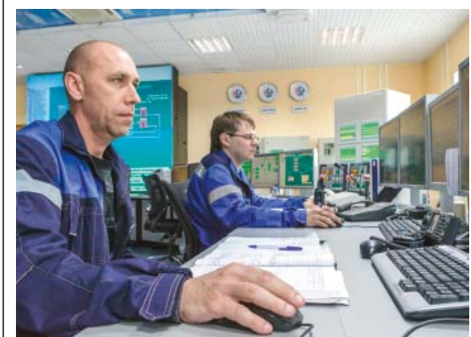
Совместные учения газопроводчиков Сургута и Ноябрьска показали слаженность действий

Напомним, что ООО «Газпром трансгаз Сургут» нынешним летом впервые начало проводить совместные противоаварийные тренировки своего дежурного персонала компрессорных станций с представителями организаций-смежников. Цель – отработать алгоритмы взаимодействия в случае возможных нештатных ситуаций на производстве.