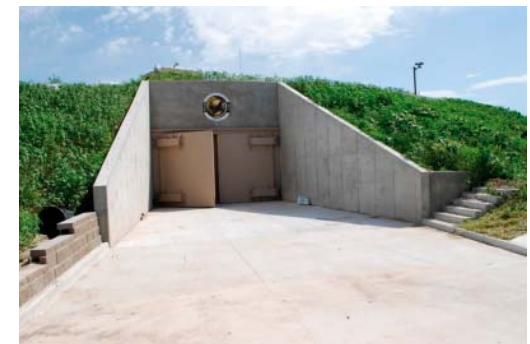
Классический вариант подземных убежищ

Специальные убежища для защиты и укрытия персонала предприятия на случай поражения ядерным, химическим, бактериологическим оружием появятся в «Газпром трансгаз Сургуте».