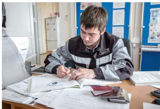
Инструктаж пройден, инженер по ОТ вносит наши данные в журнал регистрации