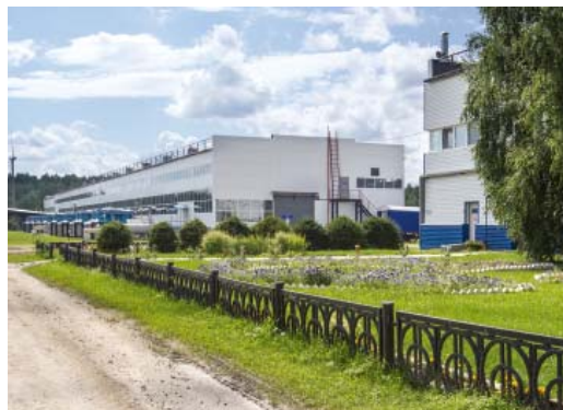
Лучшие показатели в работе агрегатов Общества – у «южных» компрессорных станций

«Демьянская», КС-9 «Тобольская» и КС-13 «Карасульская», агрегаты которых все это время функционировали в штатном режиме. Хорошие результаты показали также КС-2 «Ортыгунская», КС-3 «Аганская» и КС-4 «Приобская». А вот Заполярной и Пуртазовской промплощадкам, КС-1 «Вынгапуровской» и КС-11 «Богандинской» рекомендовано подтянуться.