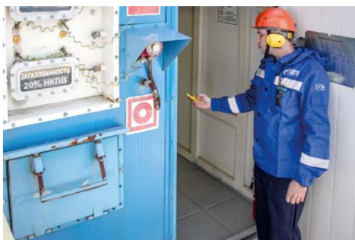
Входя в технологические укрытия, необходимо проверить уровень загазованности в помещении