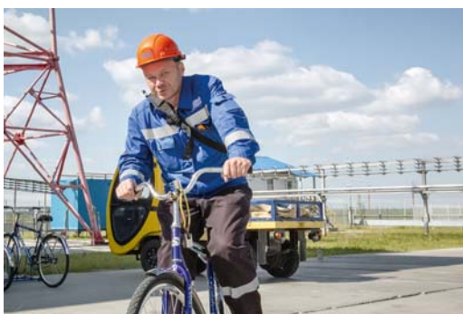
На Заполярной и Пуртазовской промплощадках разрешено передвигаться на велосипедах. Но с соблюдением техники безопасности