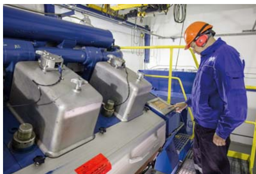
В условиях повышенного шума – в компрессорном цехе или в машинном отделении электростанции – используем наушники

тотранспортный цех, компрессорная станция, складские помещения или офисное здание. Ведь человеку всегда понятнее, когда ему показывают, как себя вести, на примере именно того объекта, где он, собственно, и оказался.