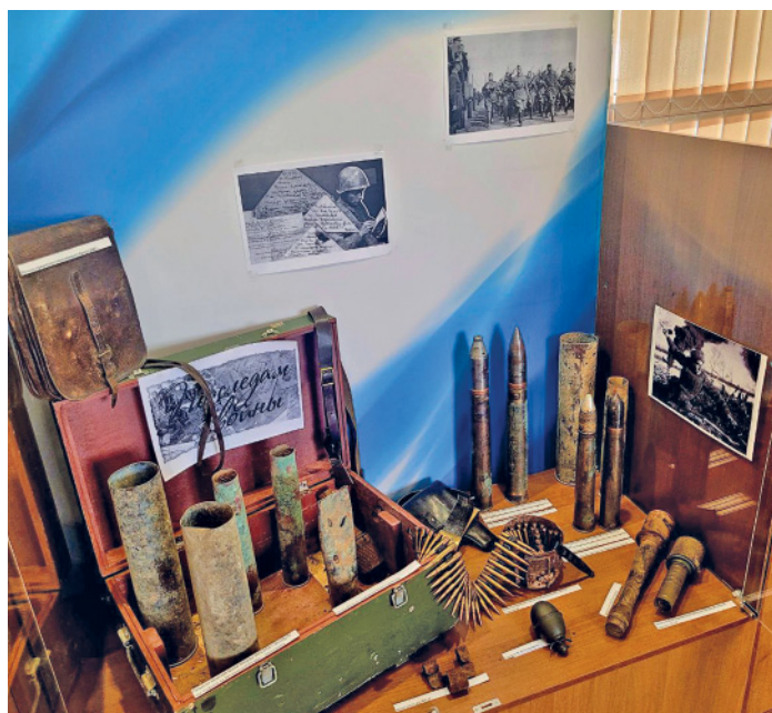
«Живые» свидетели войны, Губкинское ЛПУ