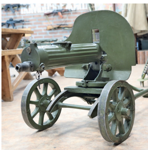
Легендарный пулемет «Максим». В его кожухе можно вскипятить чай

практически все узлы, используемые в создании орудия, на тот момент уже были освоены до этого и успешно выпускались на заводе имени Сталина в городе Горьком. Лафет – от 57-миллиметровой противотанковой пушки ЗИС-2, ствол – от стоящей на вооружении дивизионной пушки Ф-22 УСВ, которую она и призвана была, собственно, заменить. Кстати говоря, в этом и заключалось ее главное преимущество – ЗИС-3 собрана, как конструктор, из лучших на тот момент, проверенных временем и доведенных до ума разработок.