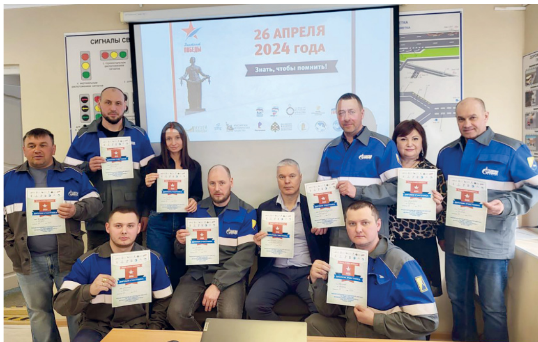
Участники акции из Ноябрьского АВП доказали, что знают о Великой Отечественной войне все

Работники различных филиалов ООО «Газпром трансгаз Сургут» приняли участие в масштабной просветительско-патриотической акции «Диктант Победы», которая прошла в городах России 26 апреля. Задания в этом году были посвящены 80-летию полного освобождения Ленинграда от блокады в Великой Отечественной войне, выходу советских войск на границы СССР, юбилеям писателей-фронтовиков, а также другим памятным датам. От участников требовалось ответить на 25 вопросов, касающихся событий Великой Отечественной.