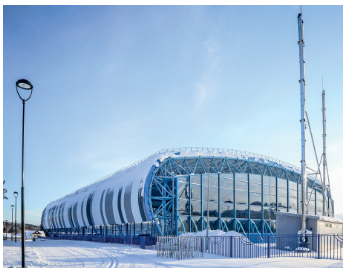
Несколько лет назад Горноправдинск обзавелся просто шикарной крытой спортивной ареной