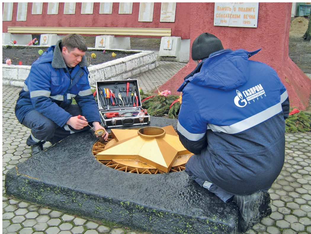
Вечный огонь

★ Благодаря специальной конструкции горелки, пламя Вечного огня на мемориалах не гаснет ни на секунду, вне зависимости от погодных условий, будь то снег, дождь или шквальный ветер. Первый Вечный огонь был зажжен в СССР на Марсовом поле в Санкт-Петербурге более 65 лет назад.