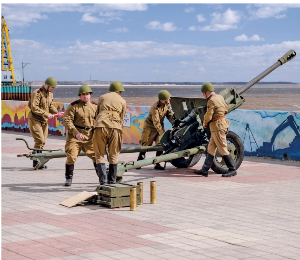
Та самая ЗИС-3 (или «Зосья») готовится к стрельбе холостыми зарядами

Эту пушку изобрел известный советский конструктор Василий Грабин буквально перед началом войны, при этом он не вложил в нее никаких революционных новшеств –