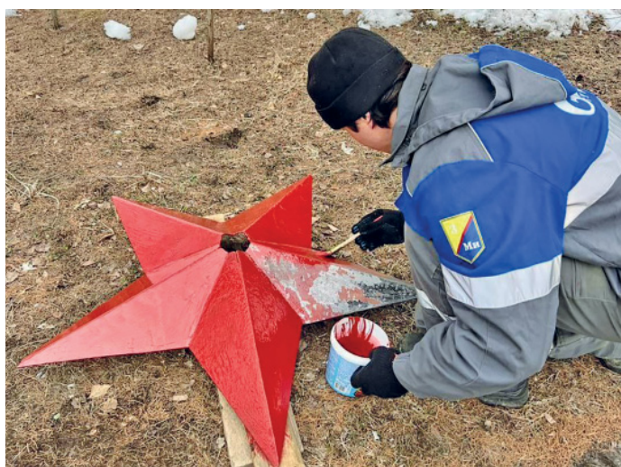
Звезда должна сиять. Салым, Самсоновское ЛПУ

селке Салым. «Субботник – это не просто добрая традиция, объединяющая трудовые коллективы. Это прежде всего забота об окружающем пространстве, нашей истории, возможность сделать полезное дело», – говорят они.