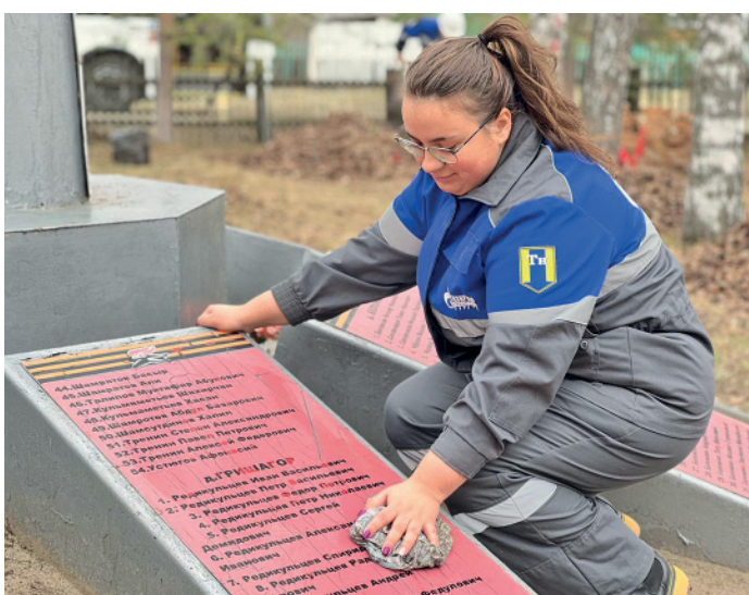
Стирая пыль времен. Деревня Овсянникова, Тобольское ЛПУ

Работники Самсоновского ЛПУ в преддверии Дня Победы вышли на всероссийский субботник: вооружившись хозяйственным инвентарем и хорошим настроением, они привели в порядок мемориальный комплекс «Помним. Гордимся» в по-