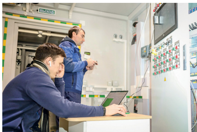
Специалисты подрядной организации тестируют автоматику