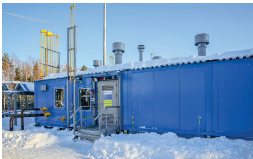
Реконструированная ГРС «Горноправдинск» в процессе пусконаладки. Сегодня она способна давать поселку 10 тысяч кубометров природного газа в сутки