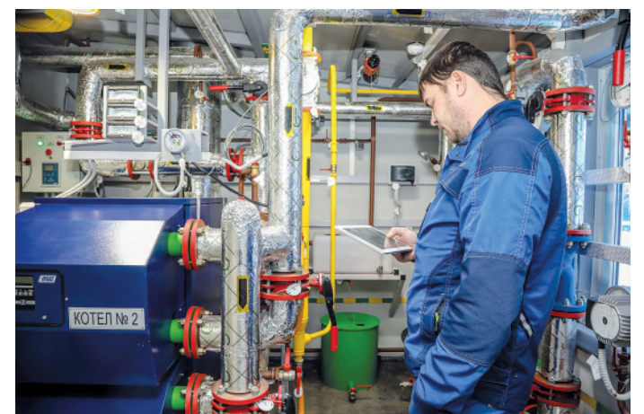
Проводится проверка работы котлов и насосов