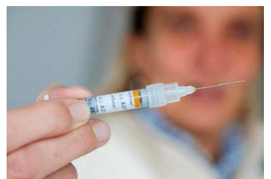
«Инфлювак»: знакомая газовикам вакцина

В этом году, согласно заявкам, поступившим из филиалов, было закуплено 2414 доз вакцины, это немногим больше, чем в прошлом (2380). Из них, к примеру, в УТТиСТ по-