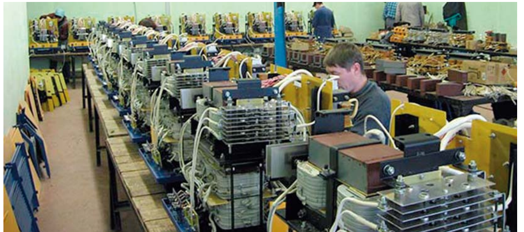
На участке сборки тиристорных выпрямителей сварочных агрегатов