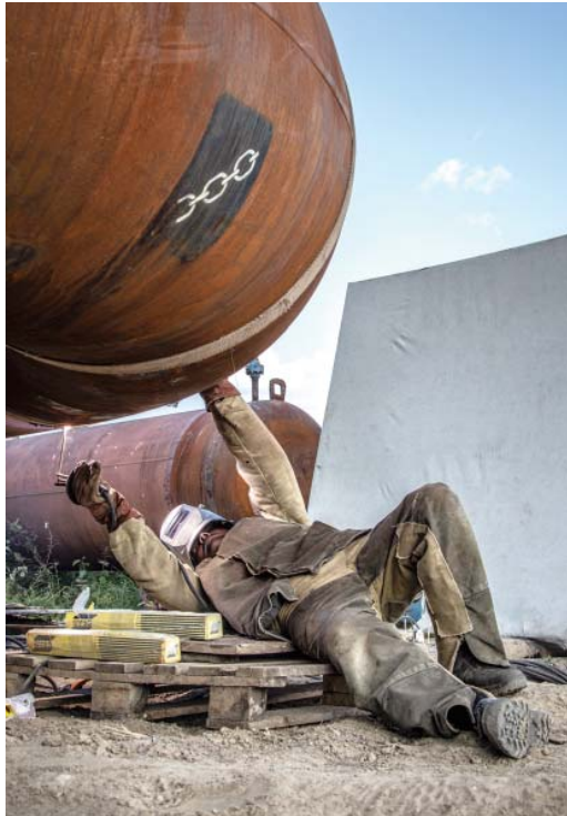
С пуском КЦ-2 КС-6 изменится и режим транспорта газа

ООО «Газпром трансгаз Сургут» готовит к запуску второй цех КС-6, остановленный в апреле этого года на проведение капитального ремонта узла подключения в рамках программы КРТТ. Основное внимание уделяется качеству газа, подаваемого в магистраль, в частности его осушению.