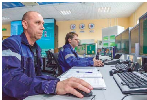
Залогом безопасности информационной инфраструктуры компании специалисты по-прежнему называют внимание и бдительность

Одно можно сказать с большой долей уверенности – эта информация попадает в базы данных и анализируется экспертными системами как в части физического лица (отправителя/получателя), так и в части организации, в интересах которой ведется переписка. Накапливая и анализируя информацию, ваши персональные данные, в этих системах формируются и хранятся огромные массивы. Добавьте сюда еще те сведения, что содержатся в социальных сетях о каждом из нас. Эта информация, ко всему прочему, используется для проведения целевых атак: зная, кто вы, где работаете, ваш стиль в переписке, круг ваших партнеров, можно очень легко подделать сообщение электронной почты от знакомого отправителя, с нужным вложением и заставить вас его открыть, то есть запустить на компьютере. Причем вложением будет специально сделанный для вашего рабочего места вирус, который не обнаружится средствами защиты... Что назы-