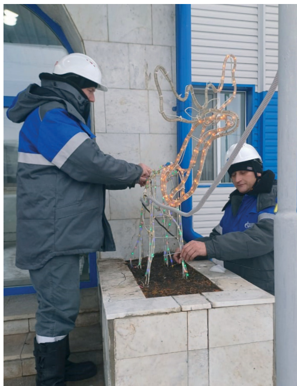
К работникам Ишимского ЛПУ примчался самый настоящий лесной олень, да еще и в лампочках. Следующий год точно получится ярким!