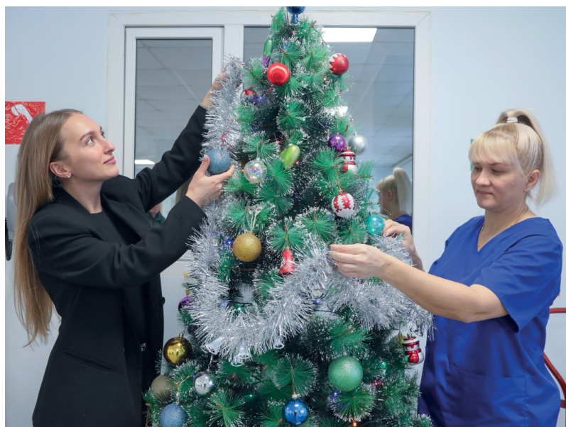
Всех вахтовиков, отбывающих с вертодрома «Черная речка», на трудовые подвиги теперь настраивает вот такая ель. Она же встречает «отпускников»