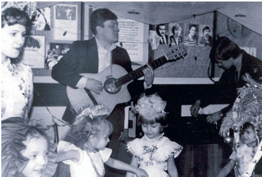
Праздник своими силами в поселке КС? Легко!

Новогодние сюрпризы на трассе магистрального газопровода имели место и в непростые 1990-е. Так, бывший главный меха-