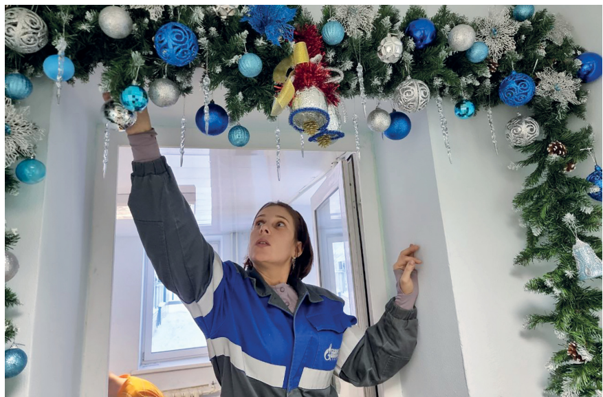
В Самсоновском ЛПУ появился настоящий волшебный портал: пробежал под ним в каске и спецодежде, и зарплата в два раза выросла. Или как это работает?