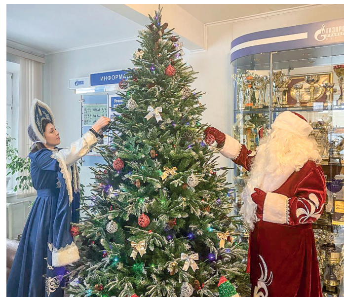
Елка в Богандинском ЛПУ получилась настолько внушительной, что рядом с ней стихийно образовалась еще одна резиденция Деда Мороза со Снегурочкой