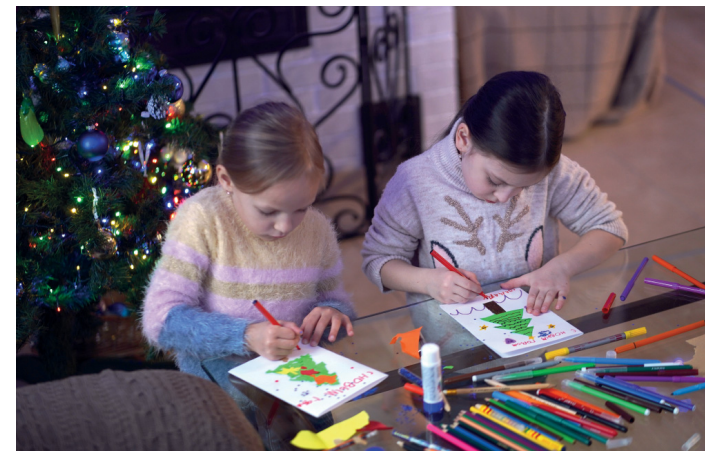
Открытка солдату готова

Гуманитарную помощь адресатам уже отправили, а часть подарков в новогодние дни представители ППО передадут раненым бойцам в Валуйском военном госпитале лично.