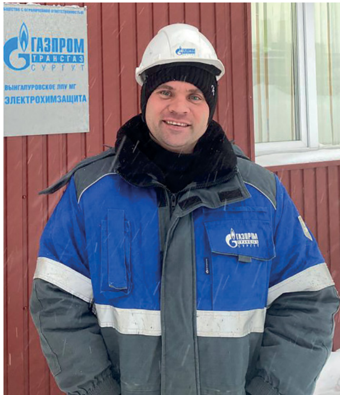
Всю свою жизнь наш герой работает в ЛЭС Вынгапуровского ЛПУ

– Получается, вслед за отцом теперь уже и я стал «дедморозить» на детских утренниках, – улыбается наш собеседник. –