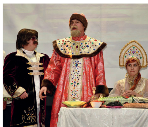
Хороших артистов всегда просят спеть на бис!

Номера для концерта подготовили восемь команд разных организаций Яркового района. Представители нашего предприятия порадовали зрителей песней «Разговор со счастьем» из культового кинофильма «Иван Васильевич меняет профессию» и произвели на зрителей настолько неизгладимое впечатление, что они попросили артистов исполнить ее на бис. Участие в «Новогодней волне» стало доброй праздничной традицией для неравнодушных и творческих людей. Команда Яркового ЛПУ присоединяется к этой благотворительной акции уже второй год подряд.