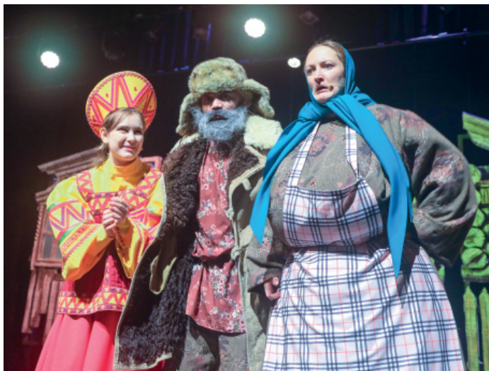
Сцена из спектакля «Морозко»