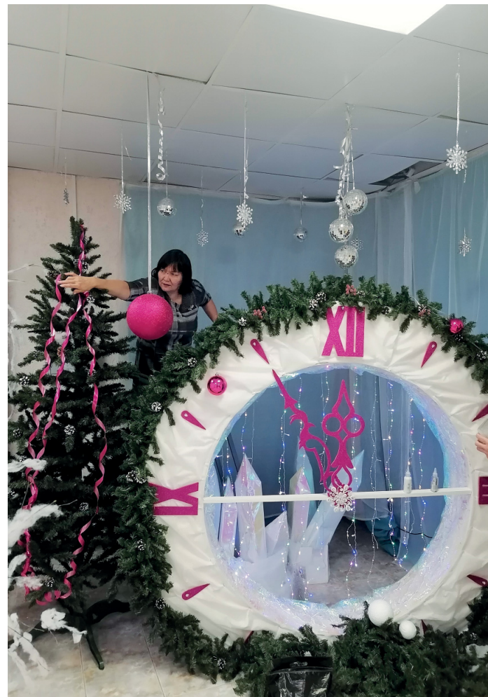
Коллеги из Ярково вспомнили знаменитый фильм и решили соорудить к Новому году вот такую композицию. Опоздать к празднику не получится ни у кого!