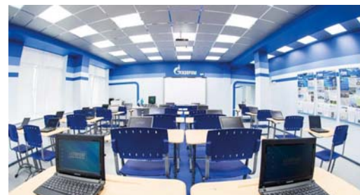
Сургутский «Газпром-класс» вооружится новой компьютерной техникой

В дальнейшем выпускники «Газпром-классов» смогут получить профессиональное образование в высших учебных заведениях по специальностям, соответствующим деятельности дочерних обществ ПАО «Газпром». После окончания профориентационного класса в случае поступления в профильный вуз учащийся может получить статус «целевой студент» и ООО «Газпром трансгаз Сургут» будет проводить дальнейшее его сопровождение на про-