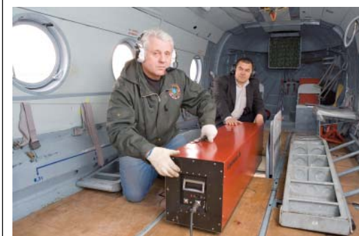
Процесс установки нового локатора на борту Ми-8

ООО «Газпром трансгаз Сургут» отправит в плановый ремонт главное орудие мониторинга магистрального трубопровода – вертолетный лазерный локатор «Аэроплекс 3 М».