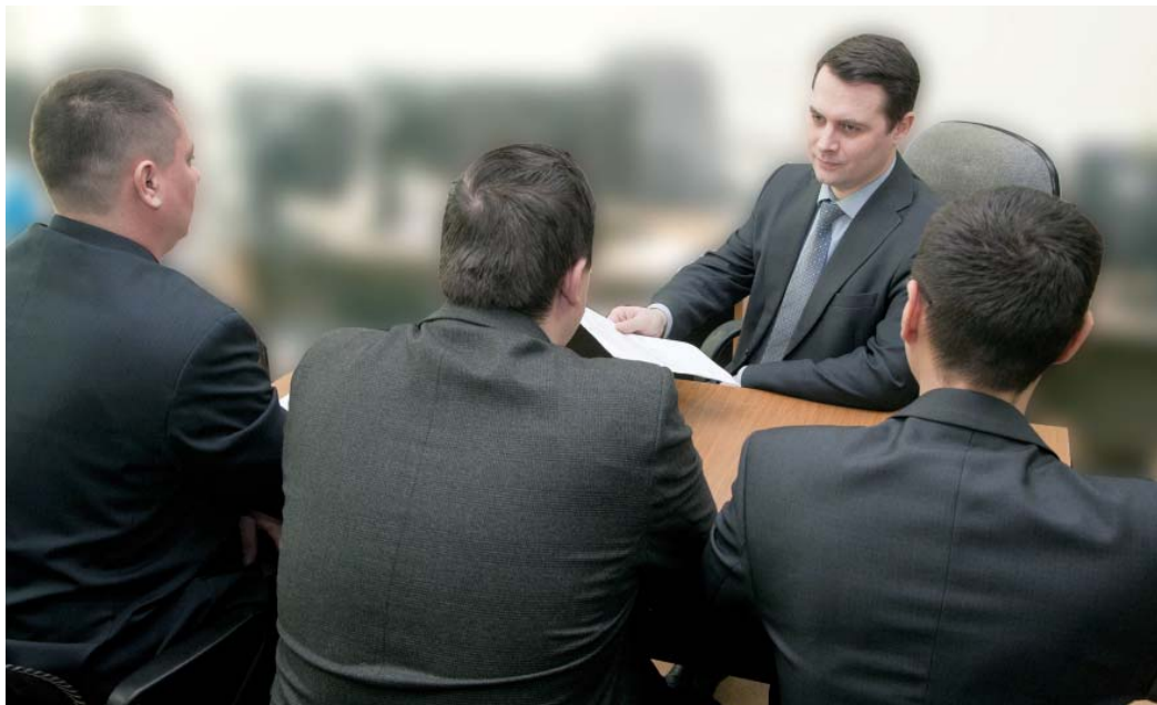
Аттестация персонала – почти экзамен. Отчет в службе ИУС

К «личному делу» прикладываются сопутствующие документы, среди которых особое место займет отзыв-характеристика непосред-