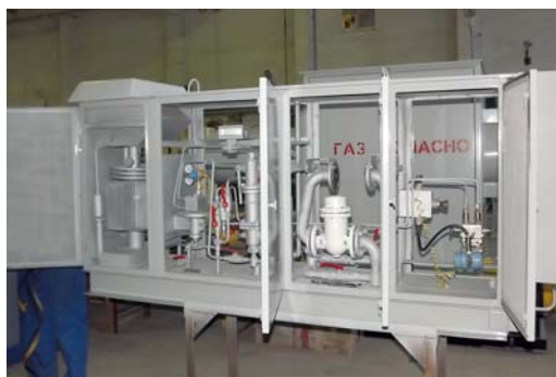
Редуцирующие пункты на компрессорных запитают объекты связистов

Новые автоматические редуцирующие пункты, предназначенные для снижения высокого входного давления газа и поддержания его на заданном уровне, а также измерительные комплексы давления, температуры, расхода и объема газа поступают на вооружение ряда филиалов «Газпром трансгаз Сургут».