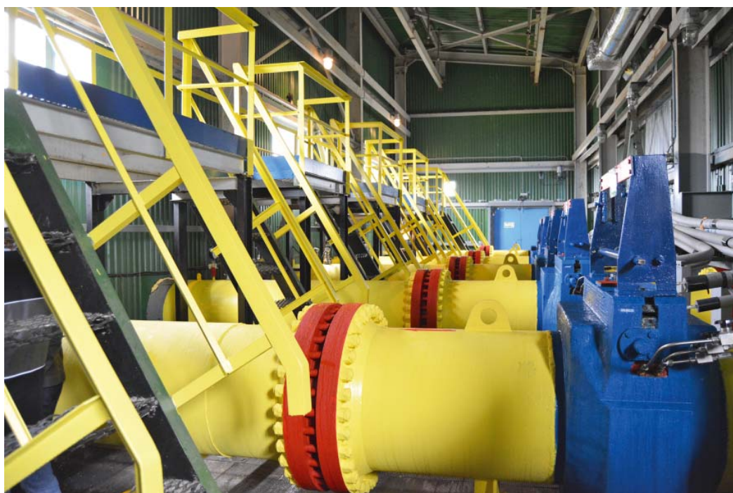
Современный узел учета газа Ново-Уренгойского ЛПУ

Оборудование проверяют на соответствие требованиям нормативной документации, на предмет своевременного выполнения поверки и калибровки средств измерений, соблюдения обязательных требований к измерению расхода и определению показателей