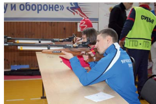
КС-10: на сдаче норматива

Команда Ярковского ЛПУ приняла участие в зимнем фестивале ВФСК «ГТО» среди трудовых коллективов Ярковского района, участие в котором приняли еще десять групп любителей спорта.