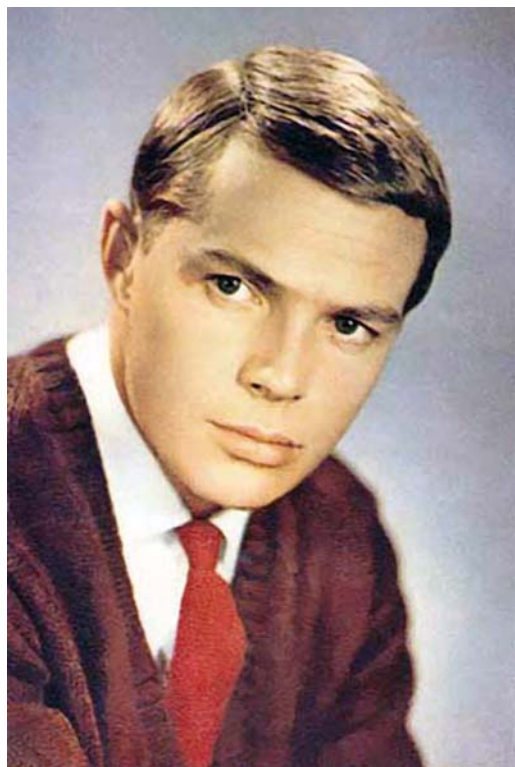
За Львом Прыгуновым у кинозрителей эпохи 80-х прочно закрепилась слава Джеймса Бонда Советского Союза