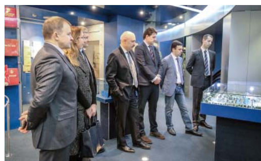
Гости посетили музей Общества

Итак, в ходе своего визита в ООО «Газпром трансгаз Сургут» руководители ООО «Газпром стройтэк Салават» рассказали о таких видах своей продукции, как монослойное антикоррозионное покрытие труб, армированный стеклотканью укрывной материал для защиты технологических трубопроводов («гитар»), биоразлагаемые заглушки для труб, средства балластировки (так называемые «пригрузки», в том числе полимерные), анкерные устройства для крепления трубопроводов, геоматрицы и геосетки для противокоррозионной защиты грунта, сваи забивные и винтовые, эстакады, быстровозводимые здания, а также многое другое. Особенно интригующе звучал рассказ о трубах большого диаметра в защитной бетонной обвязке, которые, по словам представителей ГСС, в настоящий момент уже поставляются для строительства «Северного потока». Их же планируют использовать и при строительстве потока Южного.