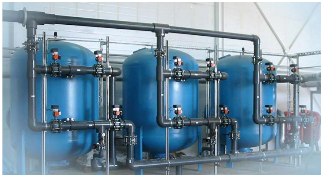
Чистая вода – залог здоровья работников и безаварийной работы оборудования

Программа «Живая вода» рассчитана на реализацию в 28 дочерних обществах. Поле ее деятельности широко – на балансе дочерних обществ и организаций ПАО «Газпром» находится более 500 сооружений водоочистки и водоподготовки (ВОС) и около 600 сооружений канализационной очистки сточных вод (КОС).