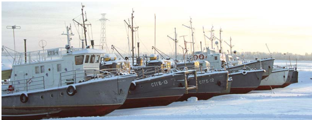
Обновление судов к навигации – на профилактику отправятся два теплохода

В составе УТТиСТ ООО «Газпром трансгаз Сургут» 17 единиц речного флота: десять самоходных и семь несамоходных судов.