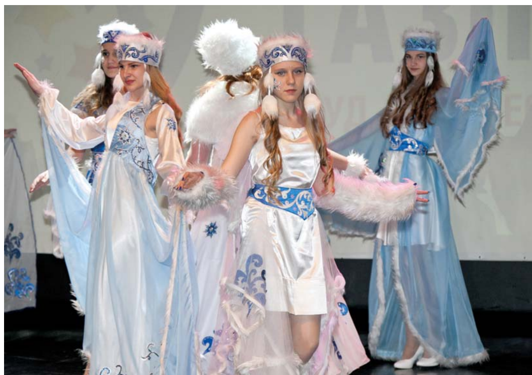
Бело-синие краски Севера