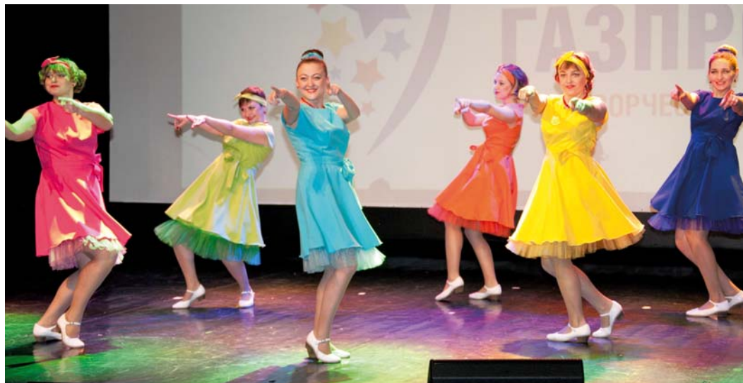
«Стиляги» Южно-Балыкского ЛПУ