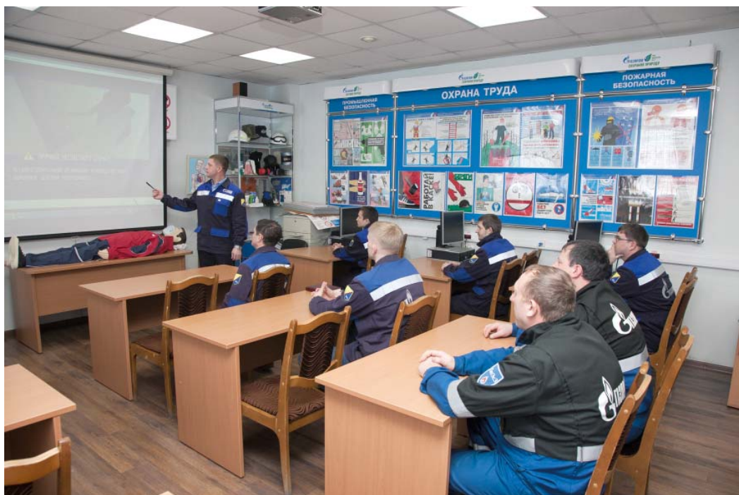
Культура безопасного производства – то, что воспитывают в себе работники Ортыгунского ЛПУ